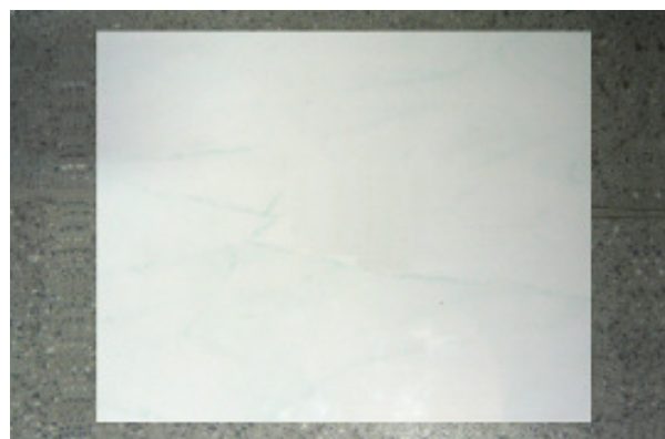
P-Modena 2050000019159 19,32 Lt Plytelės sienų 20x25

Pastaba: * kaina su PVM * kaina galutinė